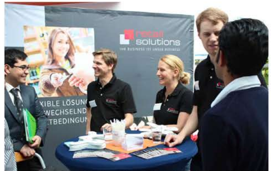
„Personalrekrutierung an einer dynamischen und anwendungsorientierten Hochschule“: So lautet das diesjährige Motto der Firmenkontaktmesse.