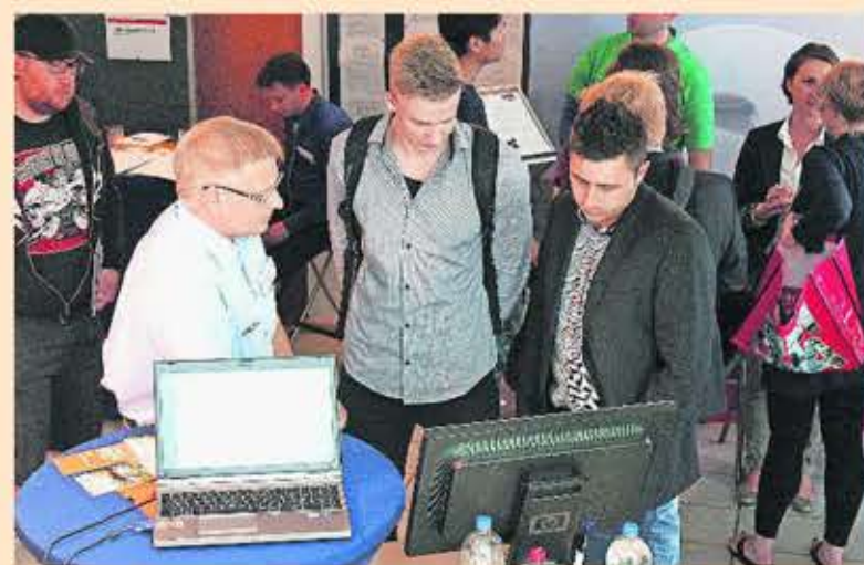
Studierende treffen potenzielle Arbeitgeber: 24 regionale, nationale und internationale Unternehmen präsentieren sich am Donnerstag, 18. Juni, am Umwelt-Campus in Birkenfeld.

zugspflicht, wobei jedoch darauf geachtet werden sollte, eine adäquate Kleidung für die jeweilige Situation zu wählen.