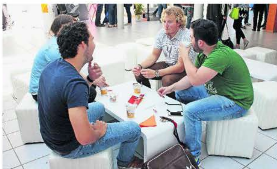
Kontakte knüpfen in entspannter Atmosphäre.

Schon vormerken: Die Firmenkontaktmesse der Hochschule Trier am Standort Trier findet am 10. November statt.